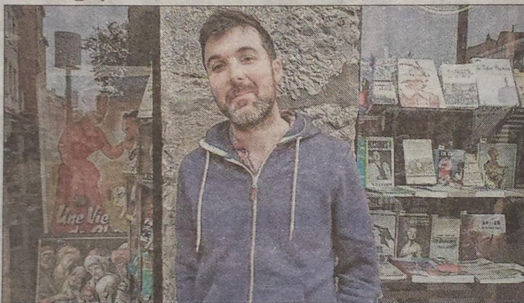
■ Denis Rivet.